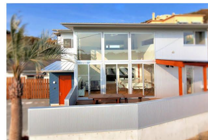
イーストコテージ

〒295-0103 千葉県南房総市白浜町滝口5792-2 TEL 0470-38-2320